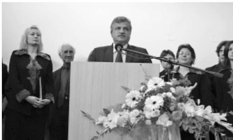
Кметът на Гоце Делчев с част от софийския църковен хор.